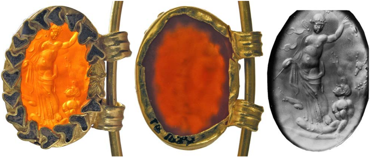
Рис. 2. Медальйон та гема з Чугуно-Крепінської гривни Fig. 2. Medallion and gem of the torque from Chuguno-Krepinka

тільки центральну частину гема. Безумовно, спочатку гема призначалася для іншого витвору, а її остання власниця навряд чи надавала велике значення зображенню. Такі речі часто трапляються у варварів. Наприклад, у багатому жіночому похованні Тенгінського могильника інтالیю на сердоліку із зображенням фігури Аполлона також було забрано у каст та підвішено горизонтально при прямовисному розміщенні сюжету [Беглова 2005, с. 170].