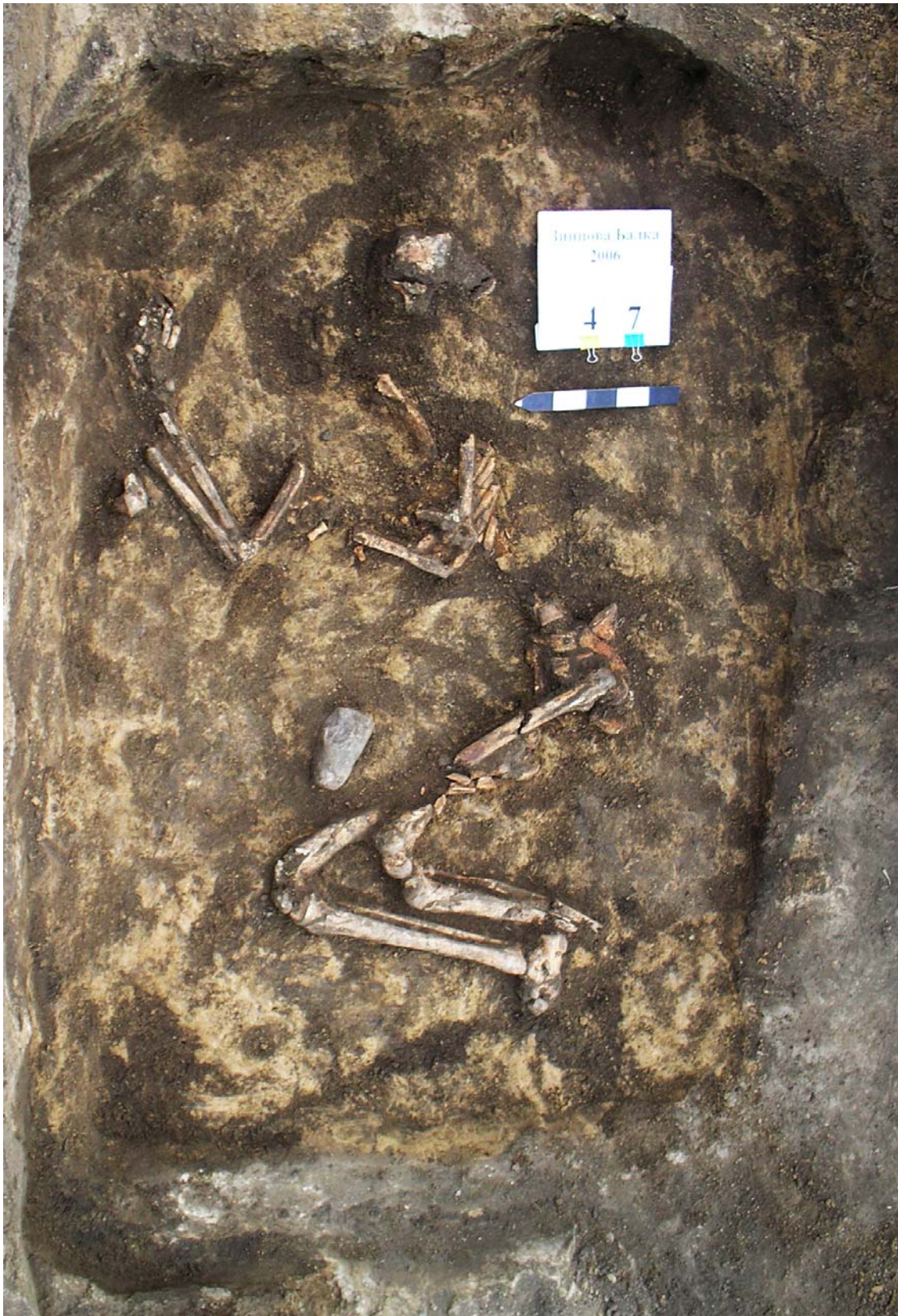
Рис. 1. Зинцева Балка, 4/7

очевидно, использовалось для дробления и растирания мягких материалов (зерно, травы) [Подобед и др. 2010, с. 113-114].